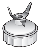
ミキサーカッター